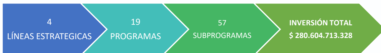
Gráfica. Extracción del Plan de Desarrollo correspondiente a la Secretaría de Infraestructura, Ambiente y Hábitat (Incluye Sub-secretarías de Vivienda y Medio Ambiente)