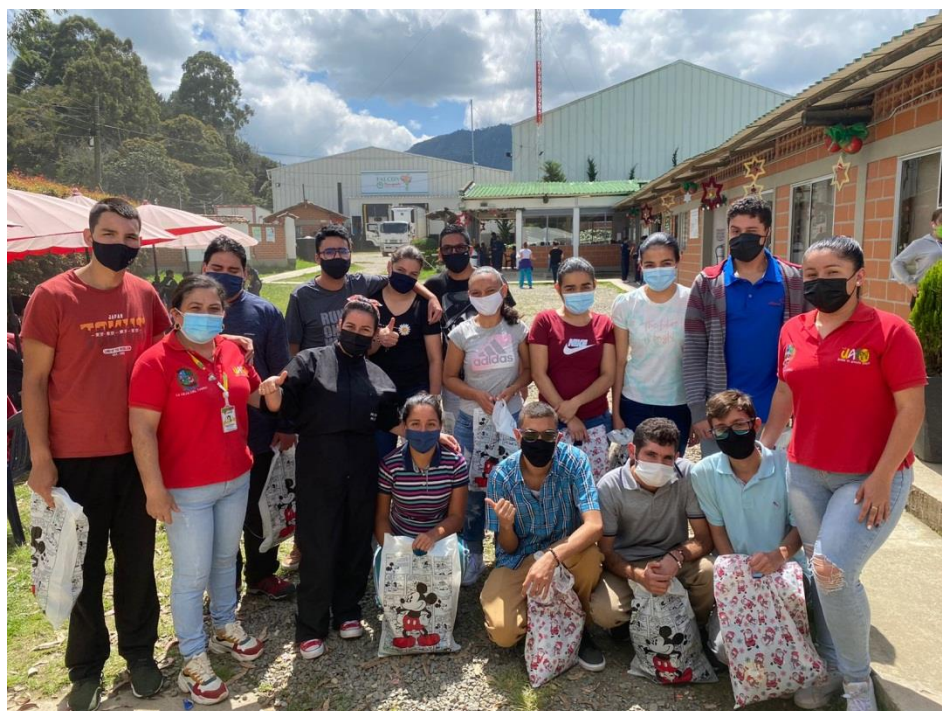
Inclusión laboral Flores Isabelita