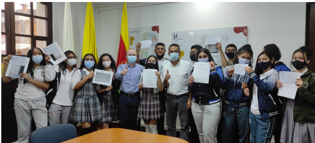
Entrega pines universitarios