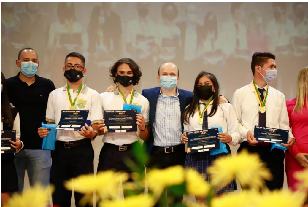
Noche de los mejores 2021